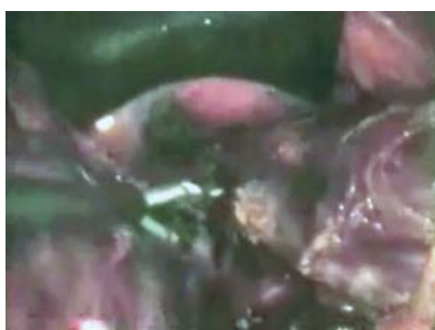
Рис. 2. Мобилизация пищевода моноблочным разъединением параэзофагеальной клетчатки с лимфатическими узлами и лимфоколлекторами

Далее аналогичным образом мобилизовали заднюю поверхность пищевода, отделяя ее от предпозвоночной фасции и аорты. Всю мобилизацию пищевода проводили с одновременным моноблочным разъединением параэзофагеальной клетчатки с лимфатическими узлами и лимфоколлекторами (не только с лимфатическими узлами, но и всем лимфатическим аппаратом — лимфатическими сосудами, нервными сплетениями с окружающей жировой клетчаткой) путем поэтапной коагуляции тканей (рис. 2).