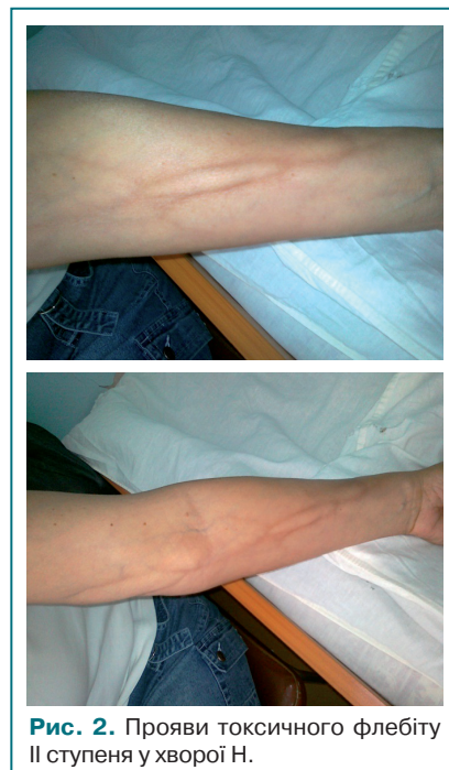
Рис. 2. Прояви токсичного флебіту II ступеня у хворій Н.