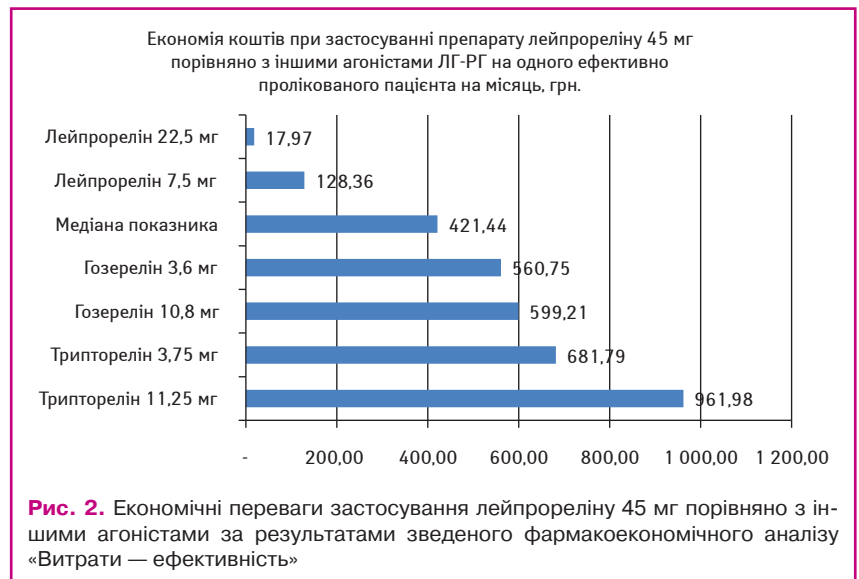
Рис. 2. Економічні переваги застосування лейпрореліну 45 мг порівняно з іншими агоністами за результатами зведеного фармакоекономічного аналізу «Витрати — ефективність»

не відмічено неочікуваного підвищення рівня тестостерону на фоні ФТ, кількість пацієнтів, у яких не відмічено неочікуваного підвищення рівня тестостерону одразу після введення ЛЗ. Економічні переваги лейпрореліну 45 мг виглядають більш вираженими, якщо оцінити економію коштів порівняно з окремими лікарськими формами (рис. 2). Так, наприклад, порівняно з триптореліном