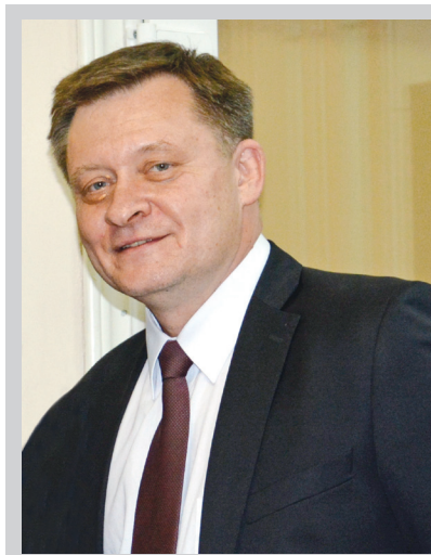
А.Б. Зіменковський 1 , М.М. Заяць 1 , М.В. Криштопа 2