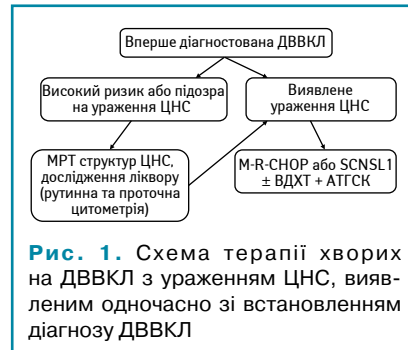
Рис. 1. Схема терапії хворих на ДВБКЛ з ураженням ЦНС, виявленим одночасно зі встановленням діагнозу ДВБКЛ

Одна з можливих схем лікування хворих на ДВБКЛ з ураженням ЦНС на момент встановлення діагнозу ДВБКЛ представлена на рис. 1.