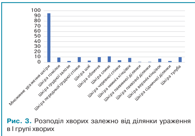
Рис. 3. Розподіл хворих залежно від ділянки ураження в I групі хворих